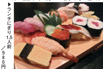
▶ランチにぎり1.5人前

に揃う。オープン 記念として山コ ース5,000円+飲 み放題1,500円 (2時間制のセツ トがなんと1,50 0円引きになるク ーポンを付けても らったのでぜひ足 を運んで頂きたい。 また、ランチは 780円からとり ーズナブルで定食 のライスはおかわ り自由。4月のお勧め魚 介、アジ、生ダコ(北海 ダコ)、海ぶどうもぜひ 食してみてください。