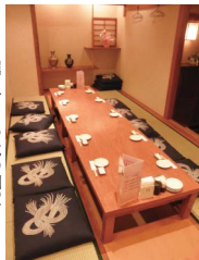
▶掘りこたつ式の個室も

東京都中央卸市場 の大田市場から仕入 れる魚介は、長年経 験を積んだ料理人が 厳選し目利きした、